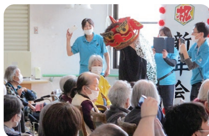
職員による獅子舞